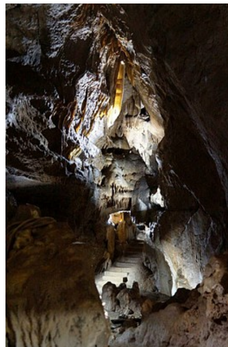
Les grottes de Remouchamps

M e e r i n f o : http://walloniebelgietoerisme.be/nl/content/grotten-van-remouchamps-een-stukje-natuurschoon-de-provincie-luik